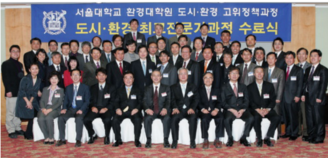
환경대학원 제7기 도시·환경 최고전문가과정 학생들의 수료식이 3월 20일 호암교수회관에서 열렸다. 34명의 수료생들을 축하해주기 위해 교수와 가족 등 약 60여명의 관계자가 참석해 자리를 빛냈다.